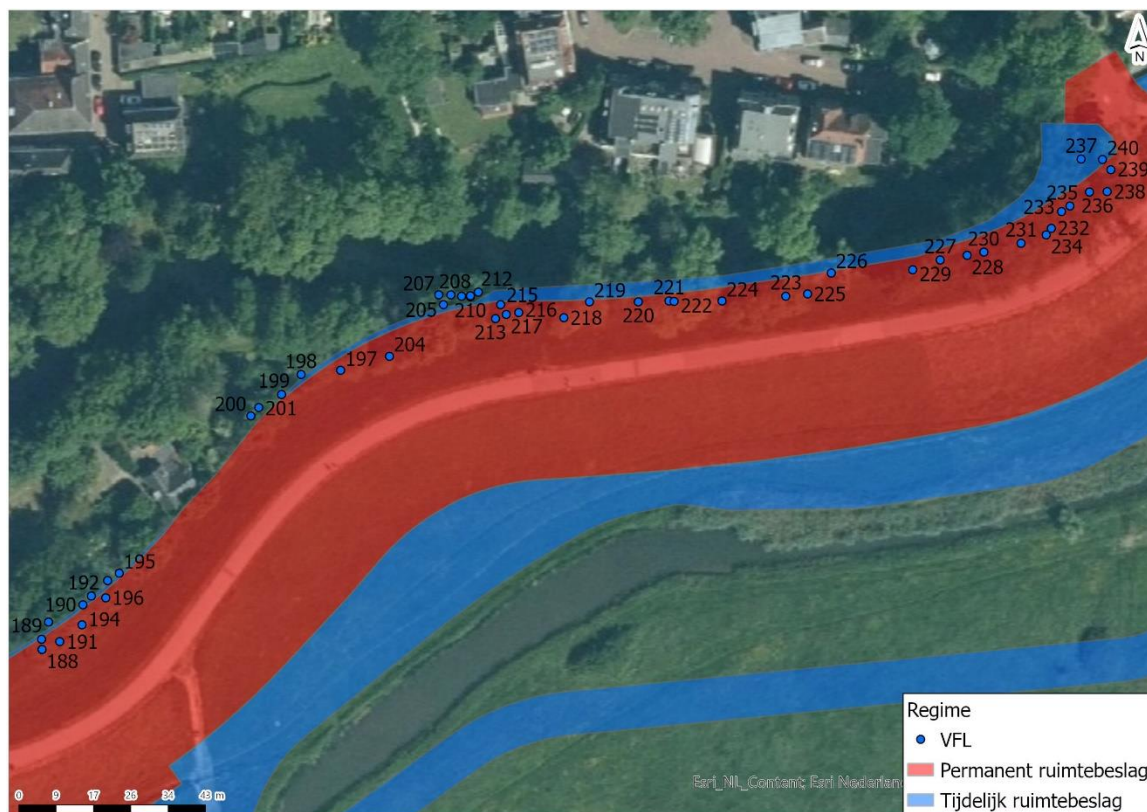
Tabel Te kappen bomen in traject 1.2 Eigendom waterschap en gemeente + enkele bomen woningstichting