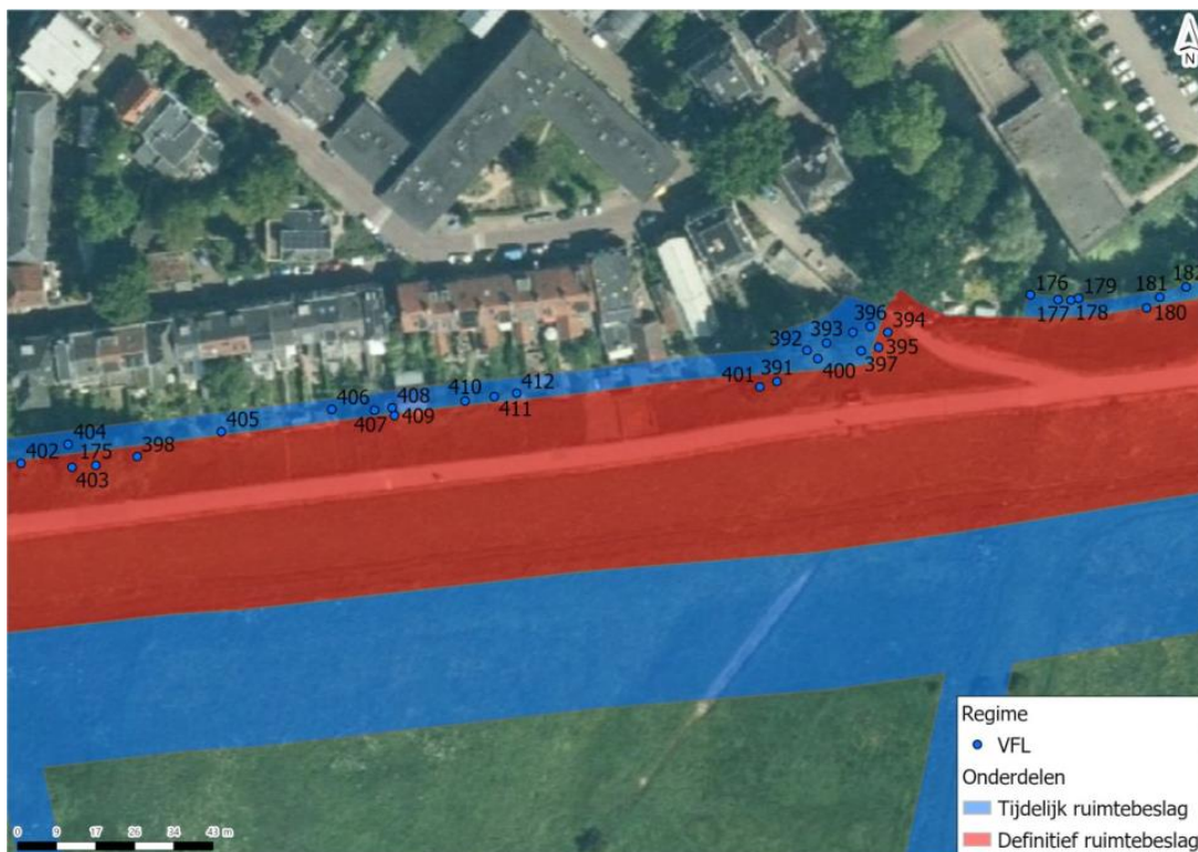
Afbeelding.2 Te kappen bomen traject 1.3 met beschermingsregime