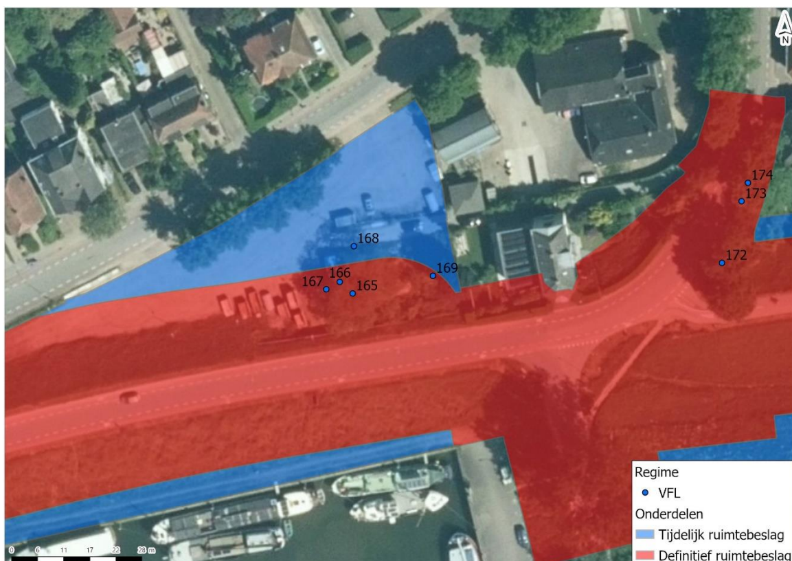
Tabel Te kappen bomen in traject 2.1